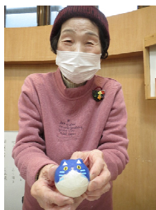
にゅんこの おきあがりこぼしも