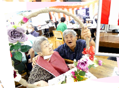
ご家族とのパーティ☆

9月16日(月) 毎年祝い年の方は施設長より表彰されます。ご利用者の中には「私も頑張らなあかなあ」とおっしゃる方や「長生きしとんなあ」と感心される方も。職員の催し物で大笑いした敬老会でした。