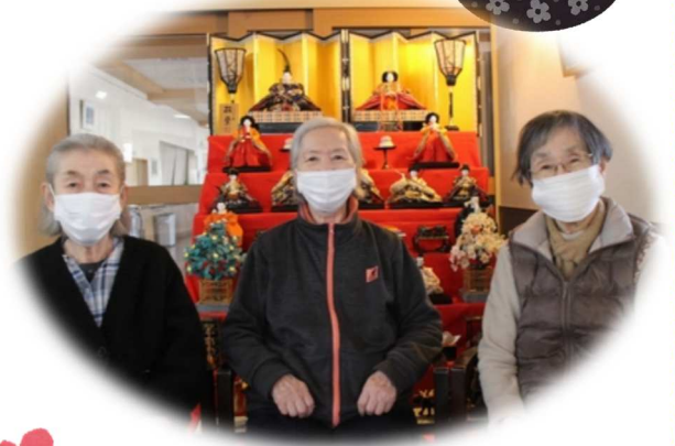
ひな人形の前でパシャリ!