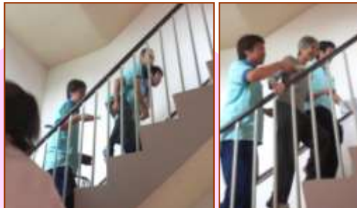
↑車椅子・寝たきりの方の場合 ↑歩ける方の場合

初めての訓練にとまどいしましたが、取り組むべき課題がみつきり、また職員は、改めて避難活動に対する気持ちが引き締められました。