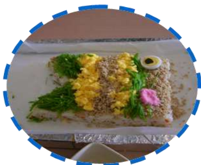
男性陣が作ったちらし寿司