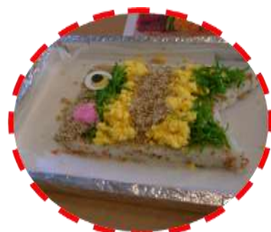
女性陣が作ったちらし寿司