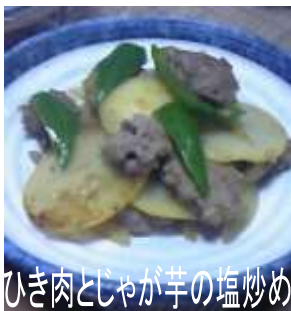
ひき肉とじゃが芋の塩炒め

写真は、訪問して、作らせていただいた『ひき肉とじゃが芋の塩炒め』です。ひき肉に塩、酒、生姜の絞り汁で下味をつけて焼き、薄く切ったじゃが芋・玉葱・乱切りしたピーマンを加え、鶏がらスープと酒・みりんを加えて炒めて、最後に黒胡椒、塩で味を調えて出来上がりです。